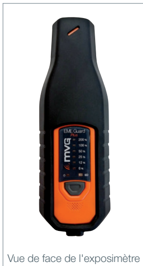
Vue de face de l'exposimètre

Instantané : dès qu'une mesure dépasse le seuil, l'alarme se déclenche.